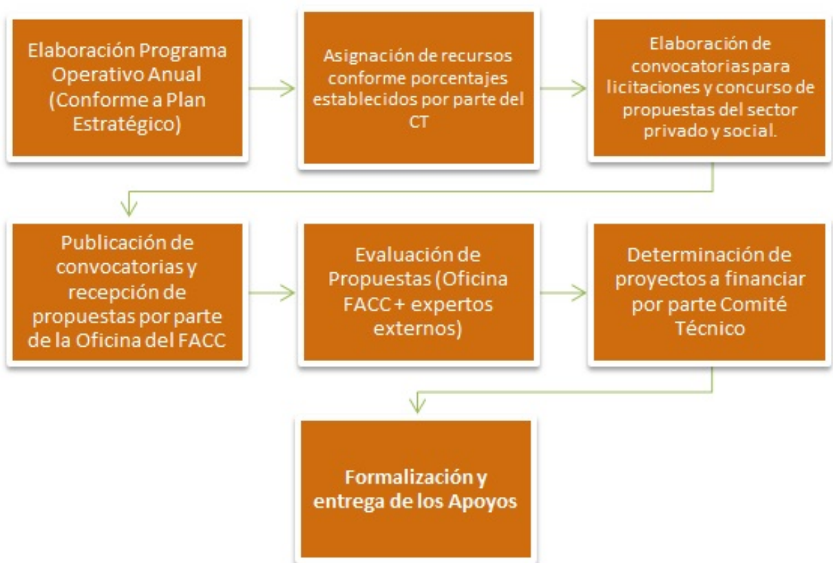
Figura 2: Proceso de asignación de recursos derivados del FACC